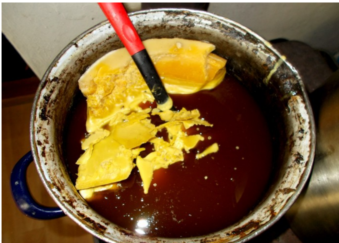
Rozpouští se pěkně

Forma má jisté drobné nedostatky. Když člověk pohlédne do buňky neuvidí přesný střed styku buněk z druhé strany, vosk jenž se zateče do škvír má sílu roztrhnout chladnoucí mezistěnu, a na mezistěně zůstávají „slévárenské nedokonalosti“, navíc je mezistěna od pohledu hrubá, což nevadí, protože včely z nadbytečného materiálu „vytahují“ stěny buněk.