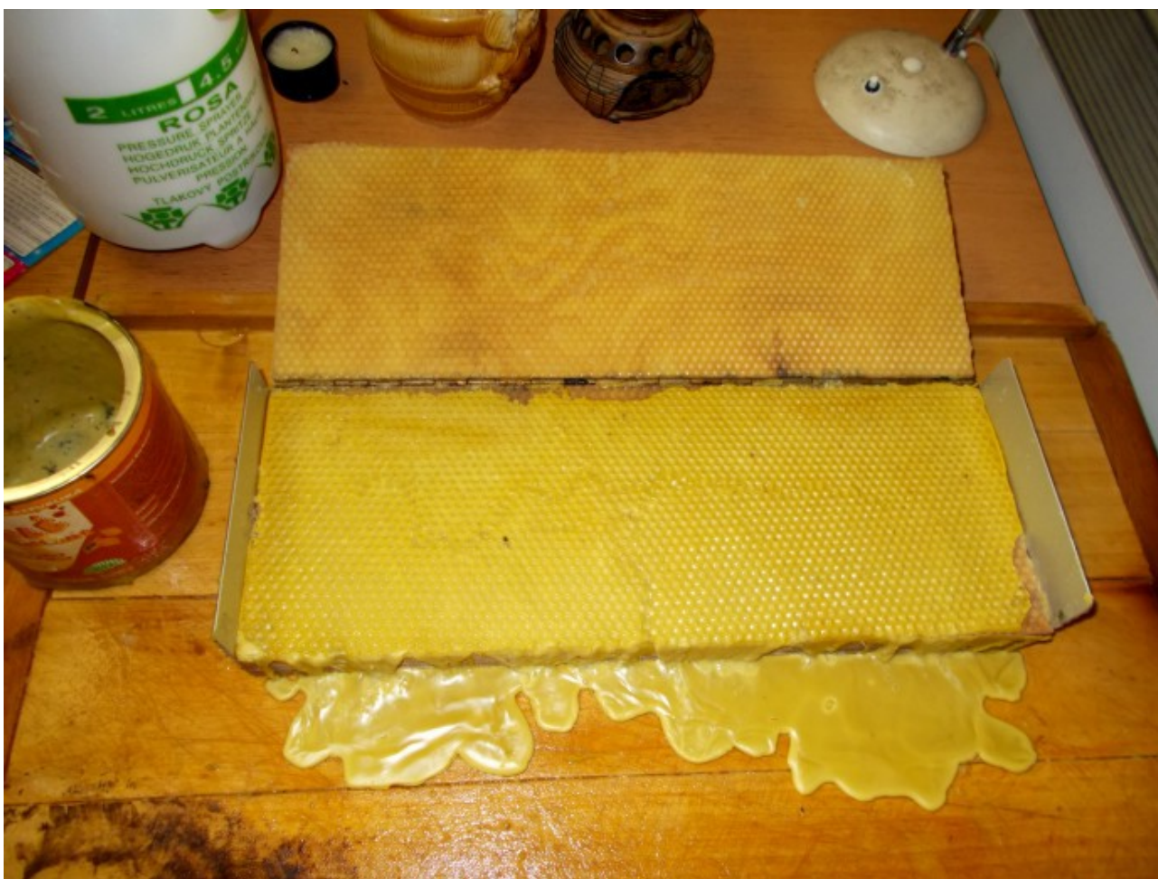
Ještě teplá mezistěna

Nyní je potřeba pohlídat místa a štěrby, kam mohl zatéci vosk, neboť síla podobného ukotvení ve formě, by mohla mezistěnu na okraji poškodit nebo i roztrhnout.