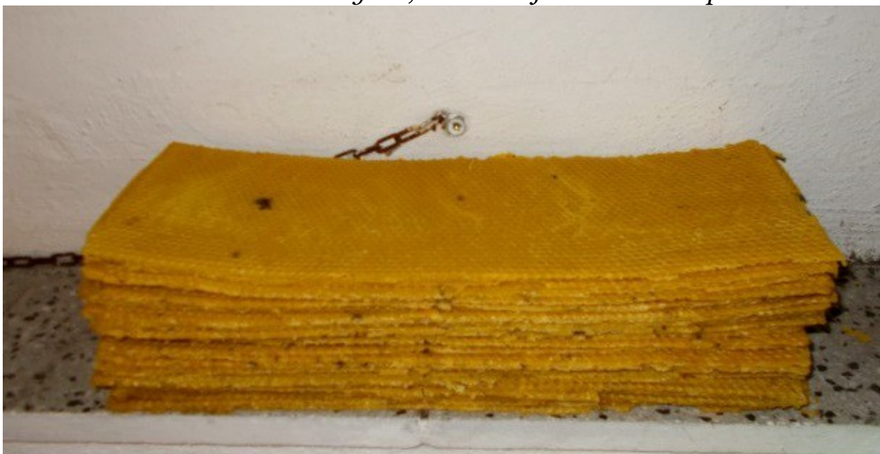
Venku na terase, po chvíli chladne utěšená hromádka mezistěň

Celá akce, by zajisté mohla probíhat profesionálněji a výsledné mezistěny by se určitě mohly více podobat průmyslovým výrobkům, na které jsme zvyklí. Já si však myslím, že drobné závady jsou znakem ruční práce, a že to tak stačí..