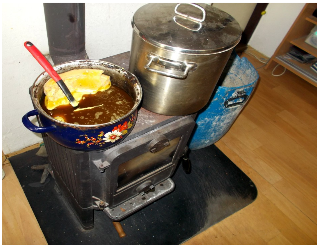
V obýváku na krbových kamnech rozpouštím vosk

Ještě bych doporučil, pokud akci provádíte, jako já v obýváku, dát si pod nohy kartón a po místnosti rozložit noviny, kvůli následnému úklidu. Velmi dobré je, být na to doma sám a nezavdat u své ženy důvod k oprávněným výčitkám a dětem nedat kreativní příklad vhodný k následování.