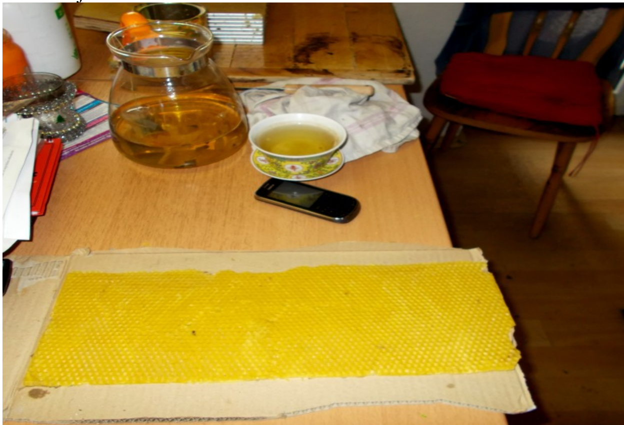
Mezistěna schne a stýdne, doušek čaje dodá klidu k práci

Po vyjmutí z formy dávám mezistěnu sušit na papírový kartón. Žádné ořezávání formátu nebo likvidaci „slévárenských nedokonalostí“ neprovádím. Na mezistěně je vidět znečištěné místo od částice starého plástu ve vosku – ani toto nijak neřeším..