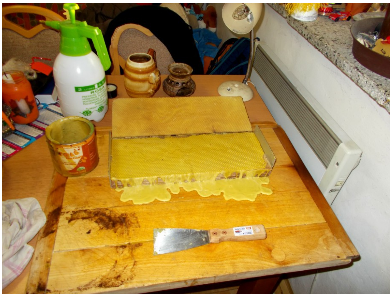
Chutě do čištění

Nejvíce času zabere práce se špachtlí, neboť je zapotřebí formu pořádně ze všech stran očistit od vosku a očištěný sražený vosk vrátit do hrnce..